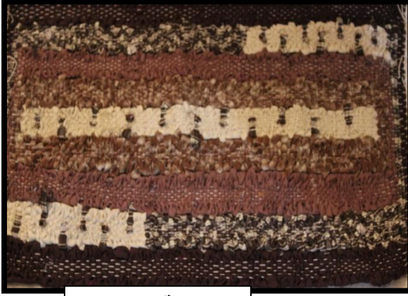
مشغولة رقم (١)