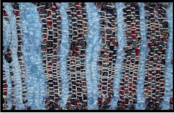
مشغولة رقم (٩)

مساحة المشغولة النسيجية ٦٠ x ٣٠ سم مستطيلة الشكل .