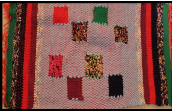
مشغولة رقم (٢)