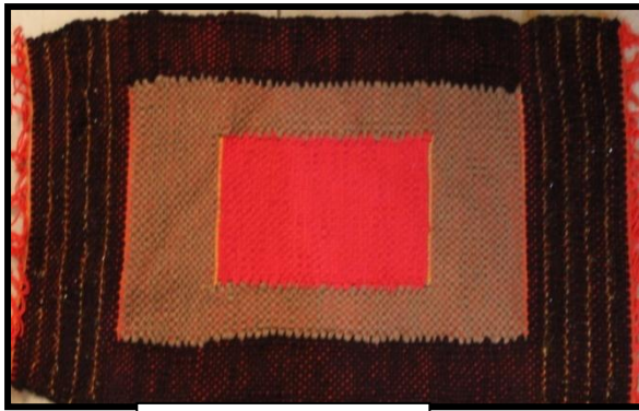
مشغولة رقم (٣)