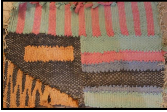
مشغولة رقم (٤)