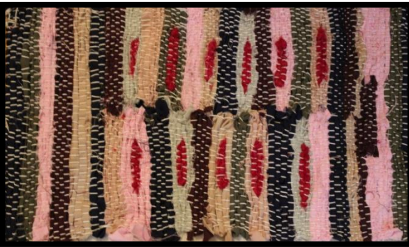
مشغولة رقم (٨)

الملامس :- تميزت هذه المشغولة بلمس حقيقى يختلف عن سابقتها بشكل الوبر الظاهر على السطح كما أن هناك أكثر من مستوى لللمس الحقيقى لتلك الخامة .