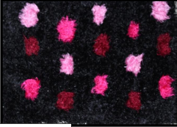
مشغولة رقم (٧)