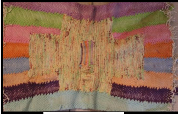
مشغولة رقم (٦)

اللون :- مجموعه متوافقة و متوازنة من الألوان المشتركة فى طبيعة لون واحد مما كان له اثر كبير فى الانسجام اللونى الذى لوحظ بالمشغولة النسيجية مما أضفى عليها طابع الهدوء النسبى الملامس :- تميزت هذه المشغولة بملامس حقيقة تأكدت من خلال ملمس الخامة ( الجل) و نتيجة ضم أجزاء اللحمة دون غيرها